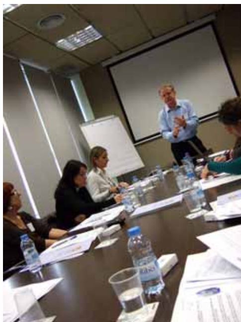
▲ Workshop Getting the Message Out. Press Officer Skills . 1 de desembre de 2010

Totes dues activitats han tingut lloc a les instal·lacions de l'Institut de Recerca Biomèdica de Barcelona al Parc Científic de Barcelona, els dies 30 de novembre i 1 de desembre de 2010.